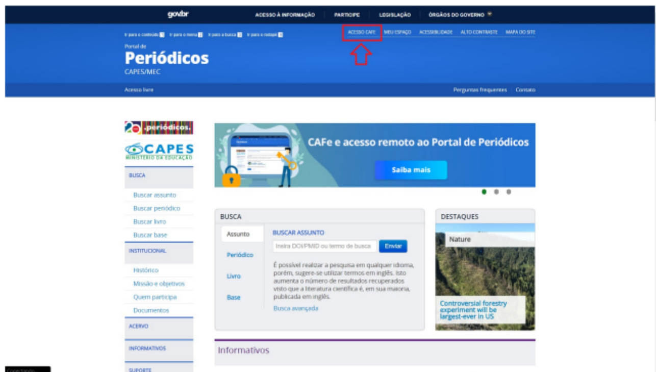
Figura 1: Acesso Cafe

Ao acessar o site Periódicos CAPES e depois clicar no link “Acesso Cafe”, conforme a figura 1 exibe: