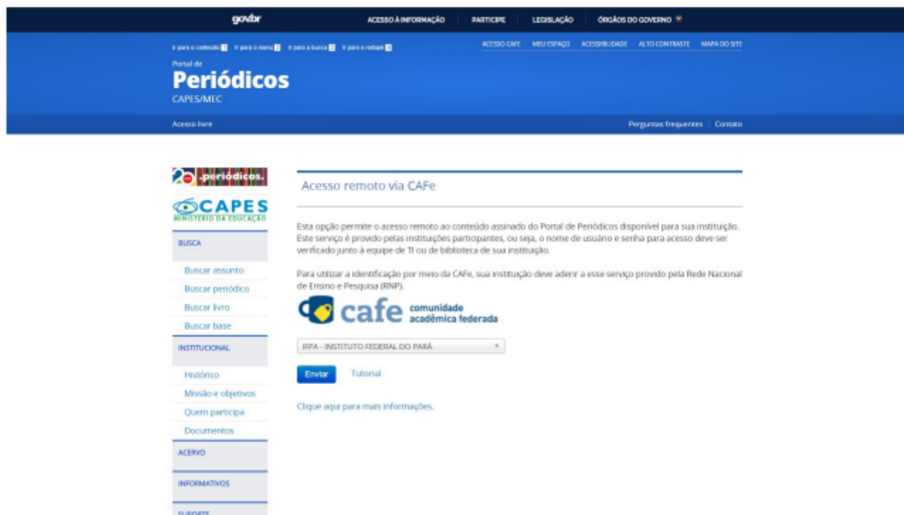
Figura 2: Escolha da instituição

A próxima tela solicita as credenciais de acesso do usuário. Se for servidor, são as mesmas do login no e-mail. Caso seja discente, deve-se utilizar as credenciais do sig, que são matrícula e senha. A figura 3 exibe a tela de login.