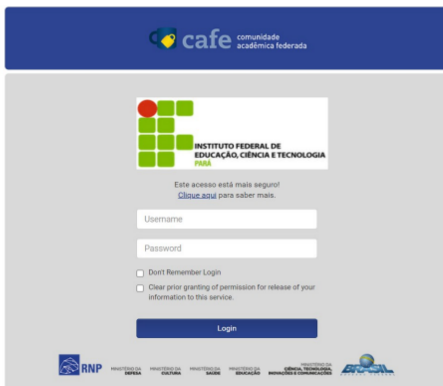
Figura 3: Tela de login

A próxima tela solicita as credenciais de acesso do usuário. Se for servidor, são as mesmas do login no e-mail. Caso seja discente, deve-se utilizar as credenciais do sig, que são matrícula e senha. A figura 3 exibe a tela de login.