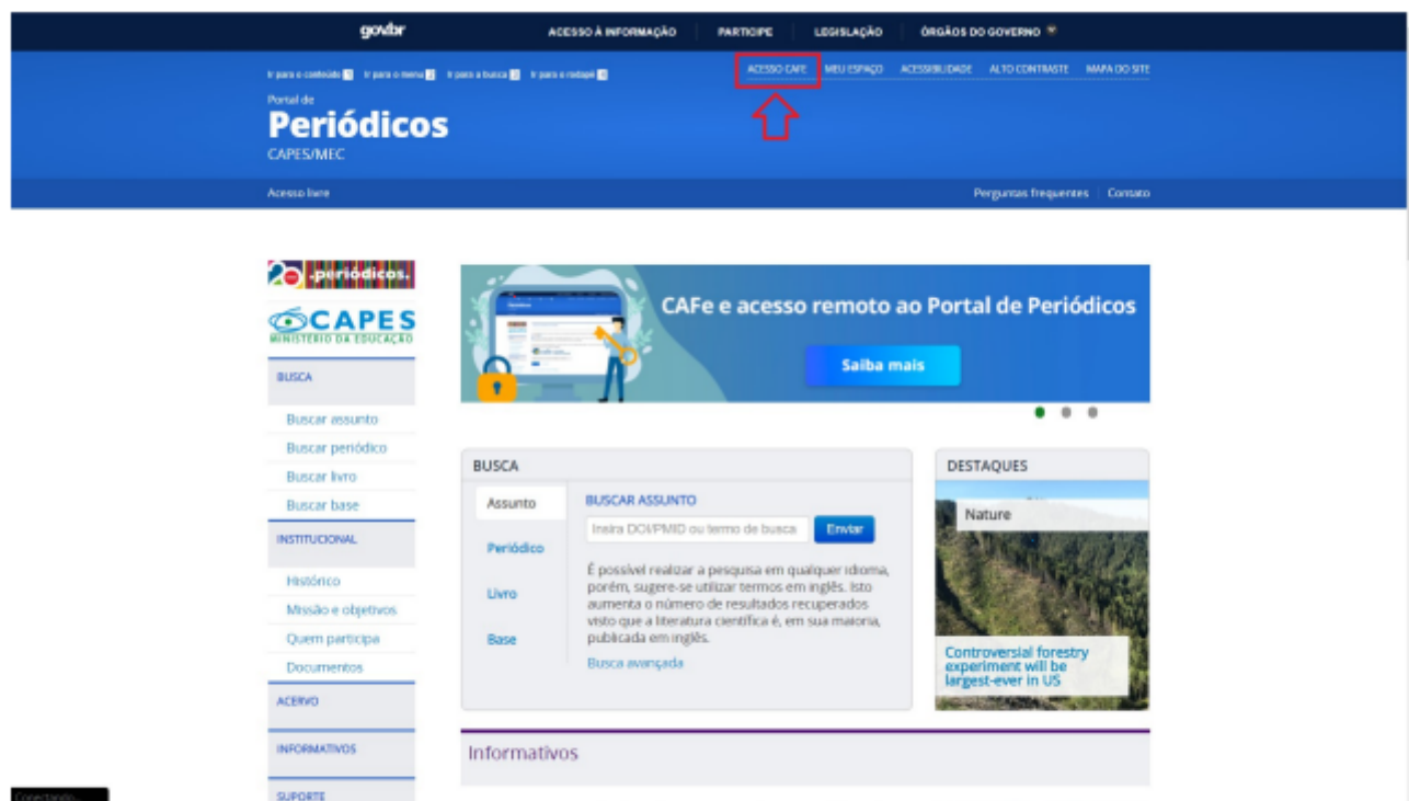
Figura 1: Acesso Cafe

Ao acessar o site Periódicos CAPES e depois clicar no link “Acesso Cafe”, conforme a figura 1 exibe: